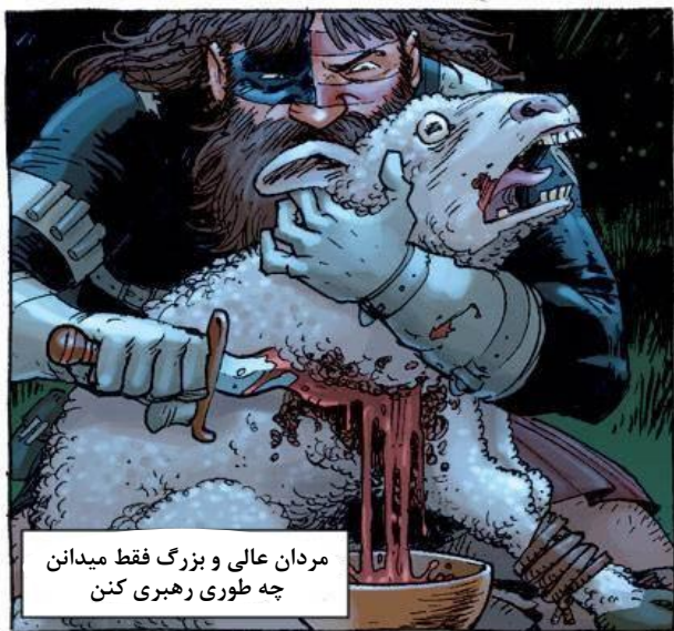
مردان عالی و بزرگ فقط میدانن چه طوری رهبری کنن