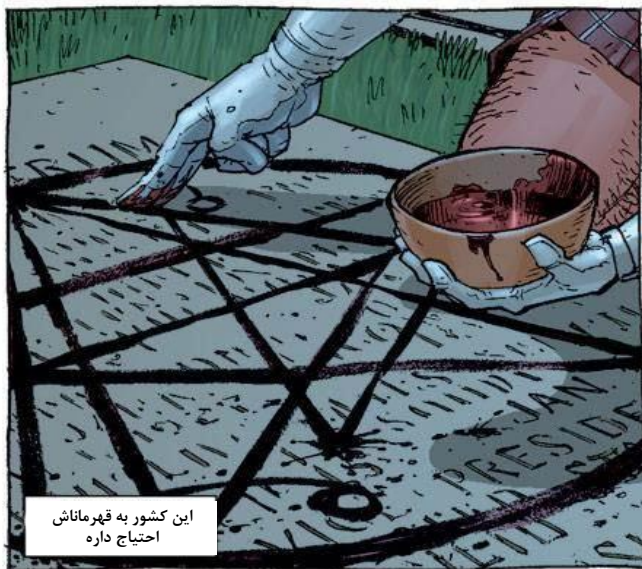
این کشور به قهرماناش احتیاج داره